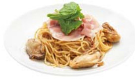
牡蠣と生ハムのペペロンチーノ