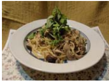
ポルチーニのカルボナーラ