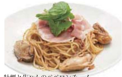
牡蠣と生ハムのペペロンチーノ セット 1,630円 (単品 1,230円)