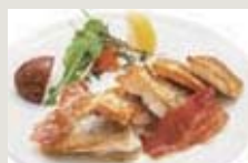
本日の魚グリル例