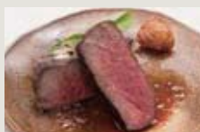
本日の肉グリル例