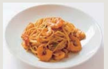
季節のパスタセット例