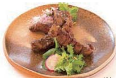
牛の中落カルビの炙り セット 300g 2,000円 / 150g 1,600円