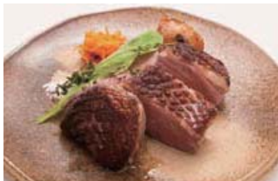
ヨーロッパ産鴨胸肉のステーキ セット 2,000円