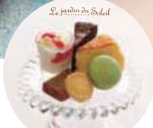
ソレイユのお菓子の盛り合わせ (清祥庵レディースセットのみ)