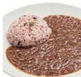
薬膳カレー セット 1,180円 (単品 780円)