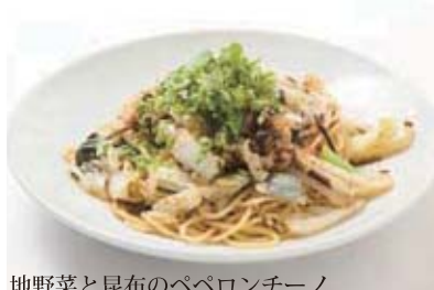
地野菜と昆布のペペロンチーノ セット 1,180円 (単品 780円)