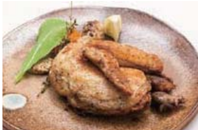
若鶏のコンフィ食べ比べ セット 1,700円