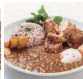
チキン薬膳カレー セット 1,580円 (単品 1,180円)