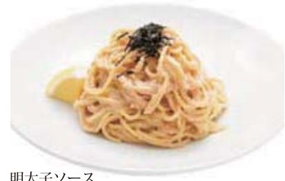
明太子ソース セット 1,280円 (単品 880円)