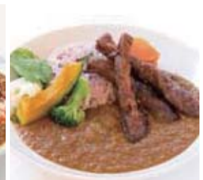
ポーク薬膳カレー セット 1,580円 (単品 1,180円)