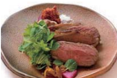
NZ / 豪産仔羊のグリル セット 2,100円