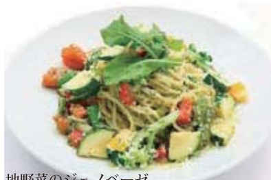
地野菜のジェノベーゼ セット 1,380円 (単品 980円)