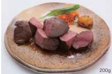
和牛ハツのサイコロステーキ セット 200g 2,000円 / 100g 1,500円