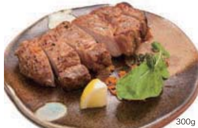
ヤマニ味噌マリネ豚ロース セット 300g 1,800円 / 150g 1,500円