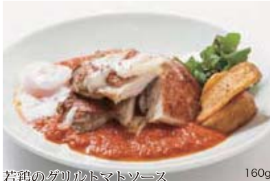
若鶏のグリルトマトソース セット 320g 2,100円 / 160g 1,700円