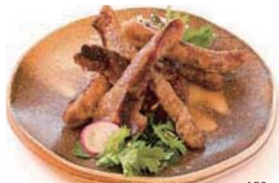
イベリコ豚の中落カルビの炙り セット 300g 1,850円 / 150g 1,400円