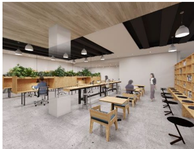
※コワーキングスペース 内観イメージ