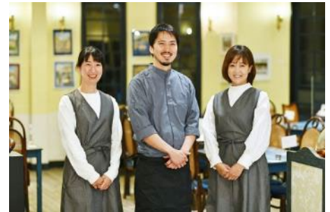
※レストランメニューイメージ