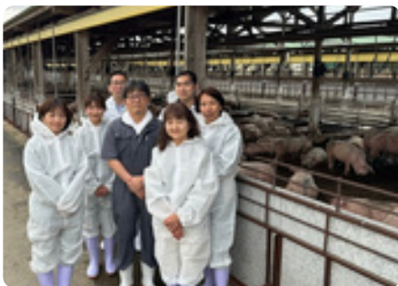
▲オリヴィアポーク生産者「丸美ミート」の皆さま

仏蘭西料理貝殻亭でお 馴染みの「オリヴィア ポーク」の特別祭を開 催します。詳細は下記 ピックアップ記事を参 照ください。 九十九里地方の温暖な 気候と自然豊かな環境 で育ち、餌はオリーブ 入り穀物主体の飼料で 育てられた豚は、肉質 はきめが細かく柔らか で、脂もほんのりと甘 みがあります。どうぞ ご賞味ください。