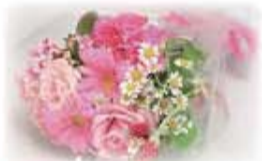
有料 お花束のご注文 ¥4,000~