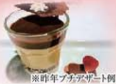
※昨年プチデザート例

バレンタイン期間:2月8日(金)~14日(木) / ホワイトデー期間:3月8日(金)~14日(木)