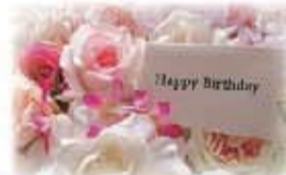
無料 お祝いのお写真カード