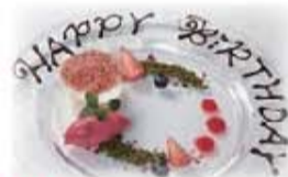
無料 メッセージ入りデザートプレート