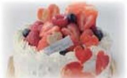
有料 ソレイユのホールケーキのご手配