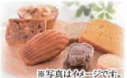
有料 ソレイユの焼き菓子セットのご手配